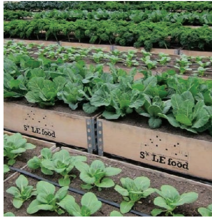
"המשימה שלנו היא להעצים אנשים בעלי משאבים מוגבלים על ידי יצירת מקומות עבודה ואספקת הכשרה חקלאית, כחלק מקהילה תומכת של חקלאים ואוהבי מזון" solefoodfarms.com