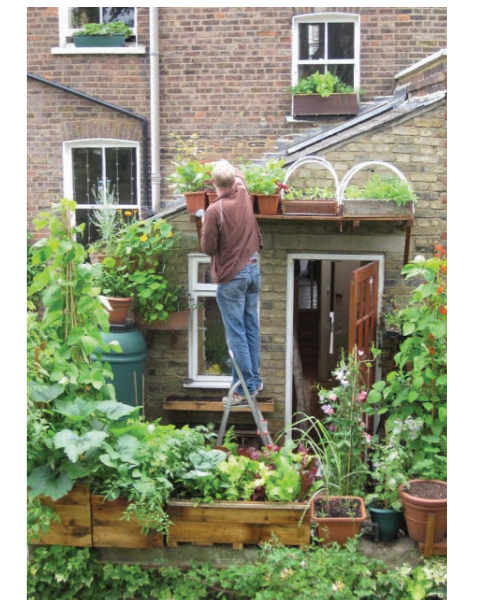
חקלאות עירונית - כל אחד יכול

בערים בכל קצוות תבל, עניות ועשירות, קטנות ומטרופוליטיות, הוכח זה מכבר כי החקלאות בעיר אינה נוגדת קידמה אלא להיפך, היא מהווה