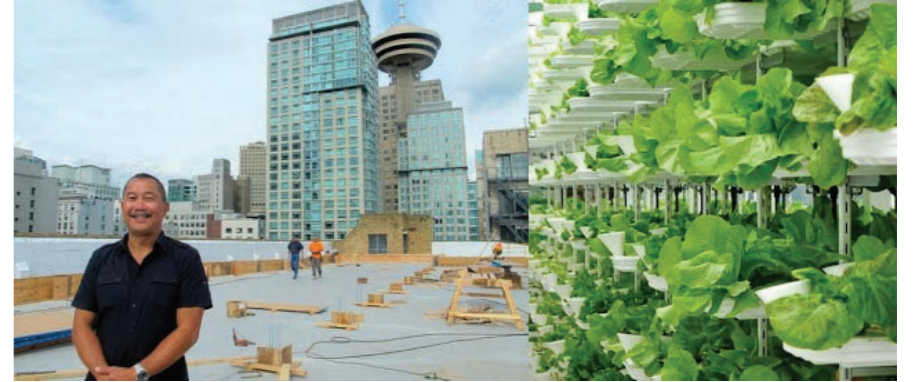
חוזה אורבנית על גג, וונקובר - גג של מגרש חניה בשטח 6,000 רגל הפך לחווה בגודל שווה ערך לשטח אדמה בן 10-20 אקר, ומייצר גידולי ירק בשווי של כ-150 אלף פאונד בשנה. זאת, ללא אדמה, דשנים וחומרי הדברה ותוך שימוש בכמיות מים מינימליות, מדויקות וחסכוניות ביחס לעיבוד חקלאי קונבנציונאלי